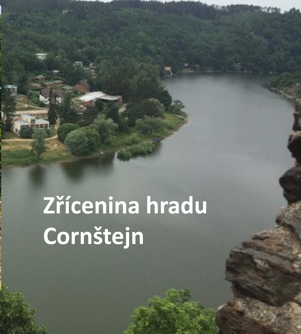
Zřícenina hradu Cornštejn